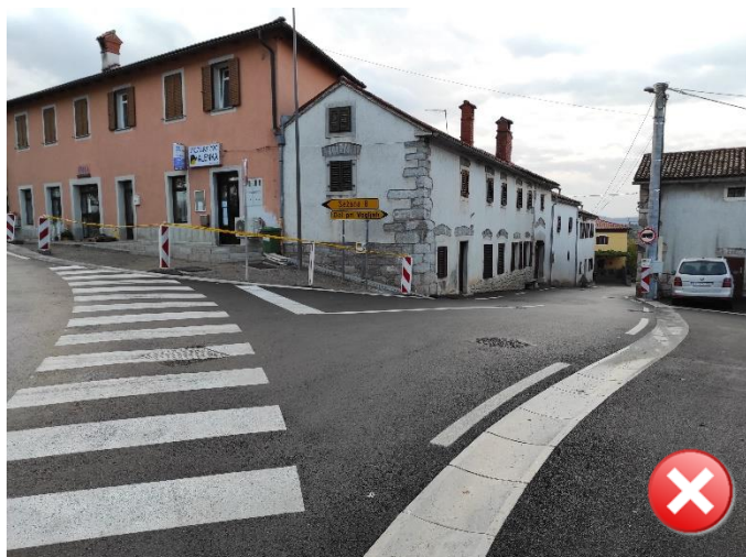
Slika 4: Učenci hodijo do postajališča ob robu ozkega vozišča. V najožjem delu med hišami pas za pešce ni označen.