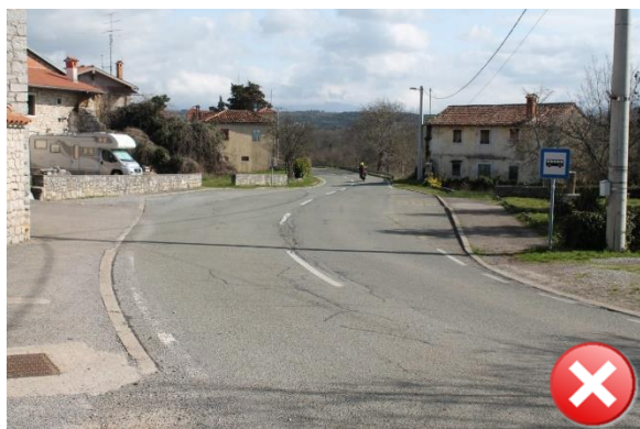
Slika 35: Nevaren odsek iz smeri Štanjel.