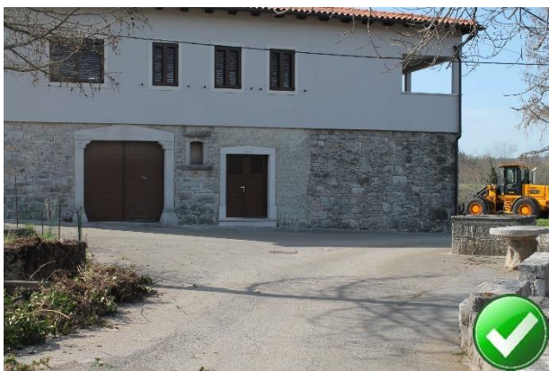
Slika 34: Postajališče ni označeno. Mesto ni problematično, ker vaška ulica ni prometno obremenjena.