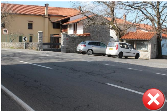
Slika 33: Nevaren odsek iz smeri Kopriva.